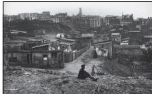
Un quartier pauvre dans la banlieue de Paris, photographie de Charles Marville, 1877.

1. Observe le plan ci-dessus. À quoi vois-tu que Paris s'agrandit et se modernise ?