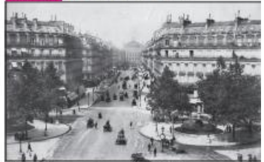
Une grande avenue haussmanienne à Paris entourée d'immeubles nouvellement construits, 1870.