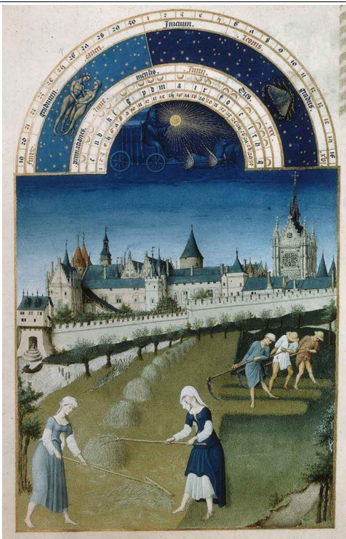
Mois de juin

Retrouve les mois suivants : février, mars, juin, septembre.