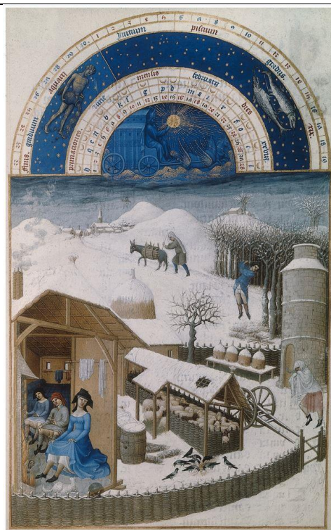
Mois de février