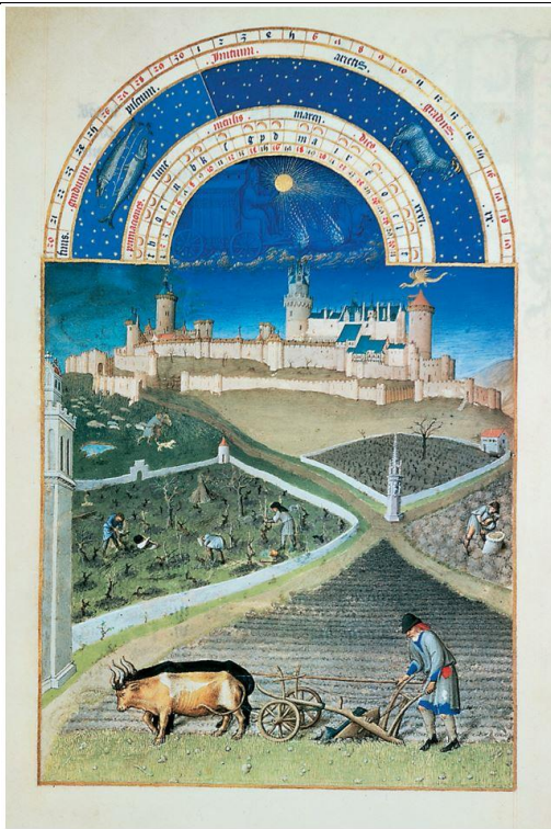
Mois de mars