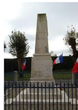
Un monument aux morts

On dépose des gerbes de fleurs devant les monuments aux morts.