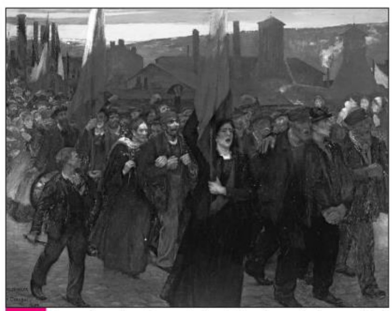
Doc. 4 Les ouvrières et ouvriers se réunissent dans des syndicats pour obtenir des droits sociaux. Pour cela ils arrêtent de travailler : c'est la grève. Jules Adler, Grève au Creusot, 1899.