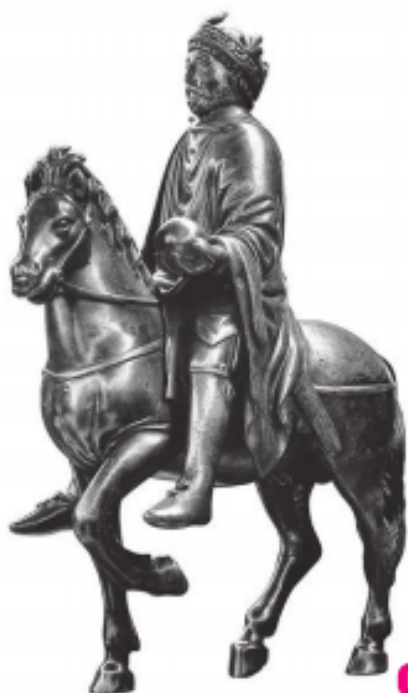
Doc. 4 Statue équestre dite de Charlemagne, IX e siècle.

Annales du royaume des Francs, IX e siècle.