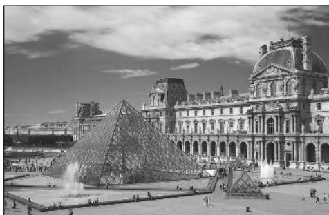
Doc. 5 Musée du Louvre à Paris.

Activités : randonnée, vélo, découverte de lieux ruraux