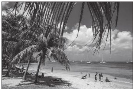
Doc. 2 Plage de la Martinique.