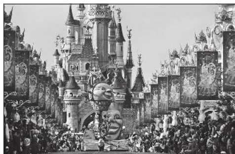
Doc. 6 Parc d'attraction de Disneyland Paris à Marne-la-Vallée.