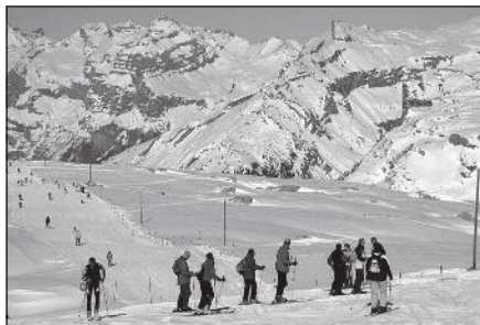
Doc. 3 Ski dans une petite station en Haute-Savoie : Flaine.

Activités : sport d'eau, détente sur la plage