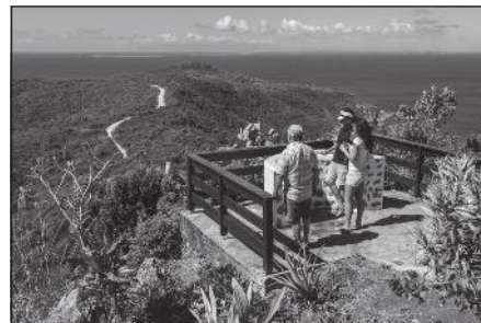
Doc. 4 Randonnée de touristes en Guadeloupe.